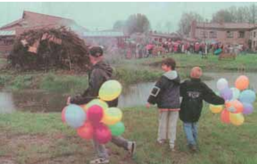
14 mei 1997, officiële opening

Uit het Noord-Hollands Dagblad een dag later: Een organisch kunstwerk van 17 miljoen gulden. Dat is de sociaal-therapeutische gemeenschap Breidablick in Middenbeemster volgens K. van Eijck van Heslinga, bestuurder van de Raphaëlstichting waar Breidablick een onderdeel van is. Gisterenmiddag werd het gebouwencomplex aan de Bamestraweg officieel geopend. De elementen water, vuur en wind stonden bij de openingshandeling symbool voor gemeenschapsleven, geestkracht en verbinding van 72 verstandelijk gehandicapte bewoners met hun omgeving. (-) Breidablick is een lang gekoesterde wens van de Raphaëlstichting. Uit de toespraak van Van Eijck van Heslinga bleek dat het plan al in 1968 gestalte kreeg. Beemster kwam als locatie pas veel later in beeld.