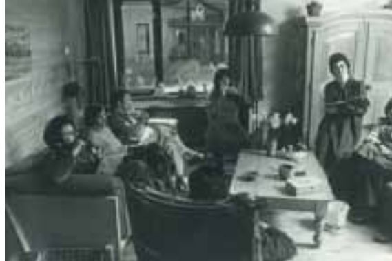
De eerste bewoners van Karminaal