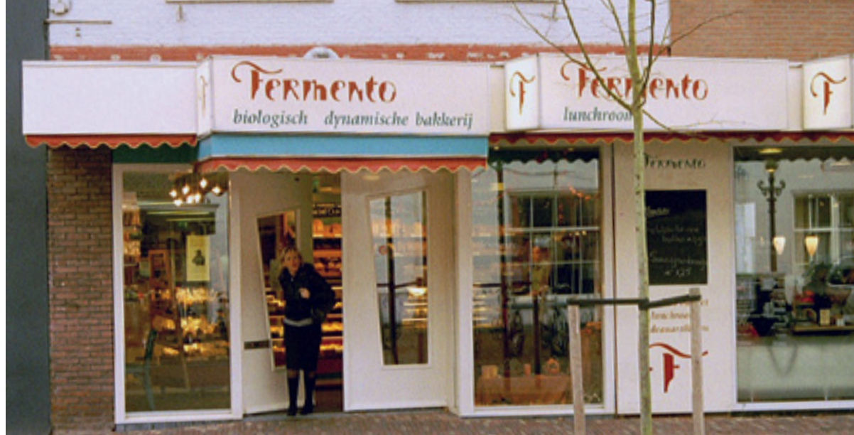
De oude voorgevel van Fermento op De Laat