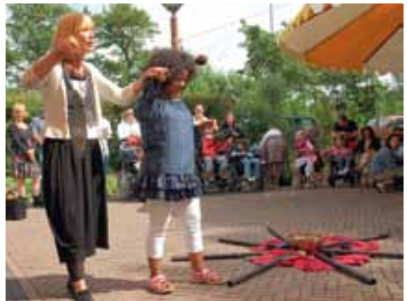
Tijdens de opening op 18 juni 2009

FERM heette het Haarlemse initiatief dat een thuis wilde oprichten voor jongeren die uit de boot vallen. Ferm: Franse naam voor een boerenhoeve in U-vorm. De groep ouders en leraren waren al jaren met de voorbereiding bezig. Zij wisten vele partijen te enthousiasmeren en hadden een stuk grond aan de Belgiëlaan op het oog. Het lukte hen echter niet de financiering van de grond te krijgen. Wel lag er al een plan voor een woongemeenschap klaar. De woningbouwcorporatie Elan Wonen was al snel ingestapt. Er waren vergaande contacten met de gemeente over de plek.