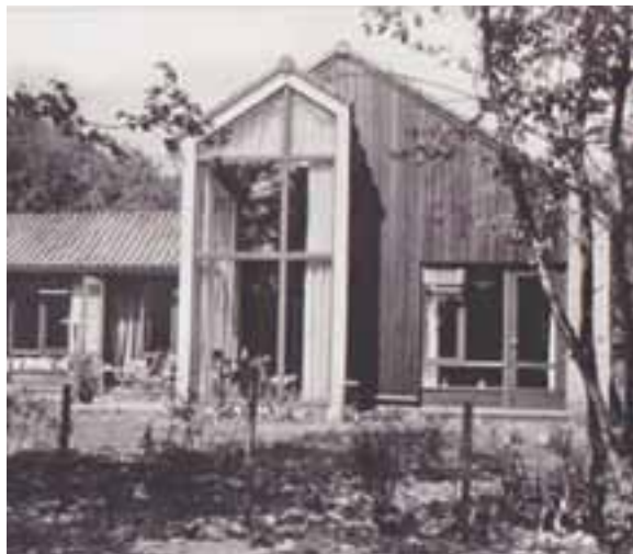
Yggdrasil en De Arend en het oude Scorlewald met het achterhuis aan de Duinweg in Schoorl