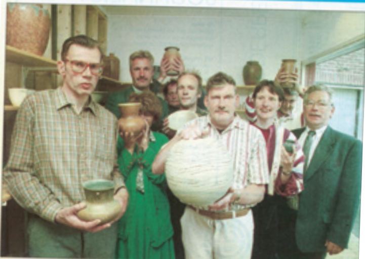
Deelnemers en directie van Scorswold, Werkvoorstelling Noord Kennemerland vierde de opening van pottenbakkerij Feniks in Schoorl.