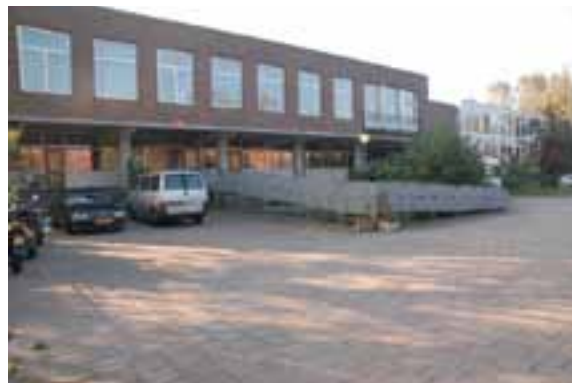
Het witte huis op het terrein van Meer en Bosch

Het 'Witte Huisje' was al snel te klein. Er was sterke behoefte aan uitbreiding van het woonaanbod. De ontwikkelkracht van Rozemarijn blijkt in 2005 de redding van een initiatief dat