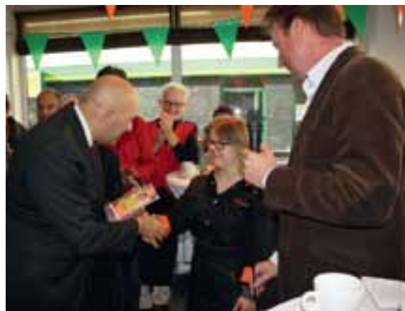
Festiviteiten tijdens het 15 jarig jubileum

(Klara werd in 2011 leidinggevende van zorgboerderij Dijkgatshoeve)