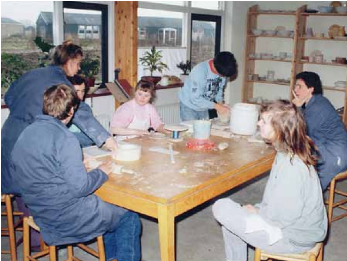
Midgard pottenbakkerij met daarachter zichtbaar de oude voetbalkantine die achtereenvolgens dienst heeft gedaan als schoolgebouw, tijdelijke medewerkerswoning, werkplaats en kinderdagcentrum De Appelboom

schap aanwezig. Ik weet nog goed ... ik zat daar midden in de zaal en gedurende die voorstelling dacht ik: hoe is het mogelijk dat zij dat doen met elkaar? Ik was getroffen hoe de bewoners daarnaar keken. Je merkte: de beelden die ze daar op het toneel zagen... die begrepen ze ook. Later hoorde ik dat het sprookje ook het thema van Midgard is. De glasramen in de grote zaal zijn daar ook op gebaseerd. (-) Ik begon als invaller op de pottenbakkerij-werkplaats en werk er nog steeds, nu al 17 jaar.