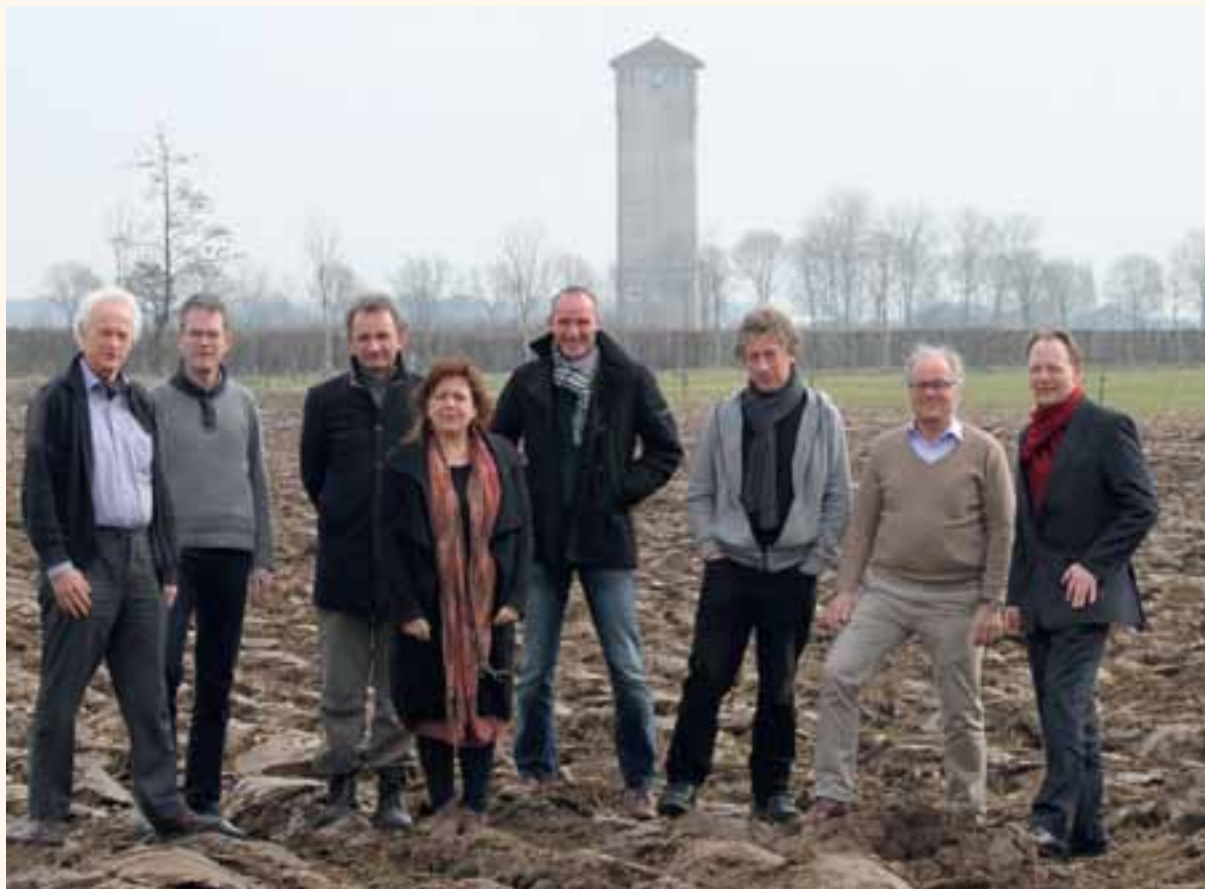
Het Management- team en het bestuur van de Raphaëlstich- ting.

Het 40-jarig jubileum markeert een moment. Want juist nu, anno 2013, verandert de inrichting van de zorg. En waar het Maartenhuis en Scorlewald ooit aan de AWBZ moesten wennen, die het