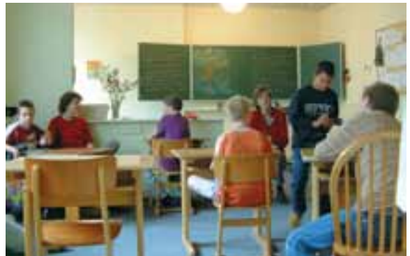
Klasje uit 2004

Op Midgard werd een paar jaar na de start deze discussie ook gevoerd. Besloten werd dat men niet in zou grijpen, zodat het kinderdagcentrum (dat ook Raphaëlhuis heette) geleidelijk op zou houden als kinderdagcentrum te bestaan. Maar voor een aantal medewerkers die echt hadden gekozen om met kinderen te werken en dat wilden blijven doen, was dat moeilijk te aanvaarden. Zij namen het initiatief om een kinderdagcen-