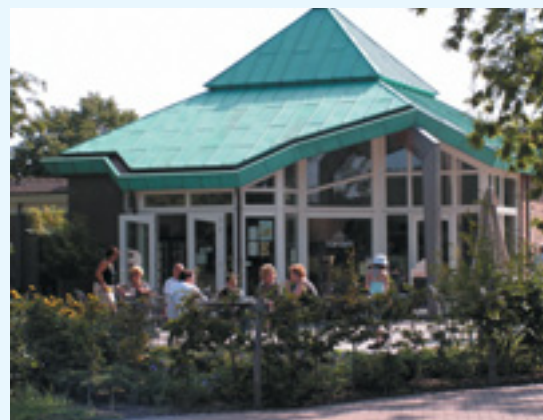
De winkel Kardeis is een blikvanger voor Scorlewald

Het verzorgen van de terrasmeubels, terrastegels en de beplanting hoort ook bij de werkzaamheden. Om bij ons te mogen werken moet je kunnen omgaan met het koffiezetapparaat en de afwasmachine, en je moet ook een beetje kunnen rekenen en lezen. Wij letten speciaal op een goede, frisse verzorging van het uiterlijk.