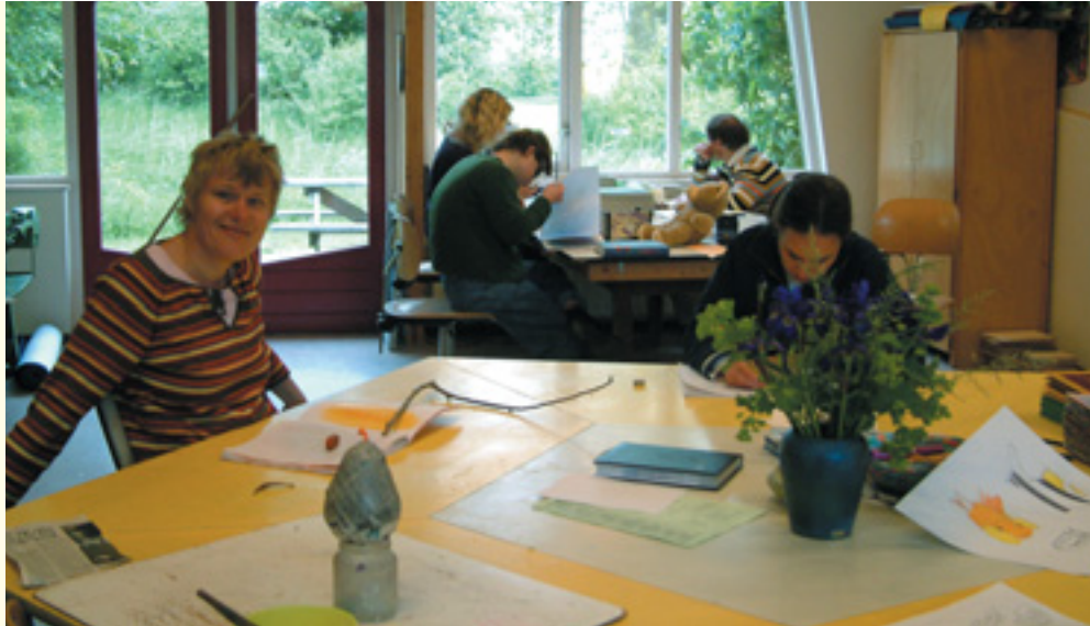
Serene rust in de papierwerkplaats

Twee dagdelen in de week verzorgt de papierwerkplaats de opvang van gepensioneerd bewoners van Scorlewald.