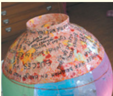
Een kleine foto van een grote vaas, ca 50 cm

We hebben een levendige werkplaats waar veel gebeurt.