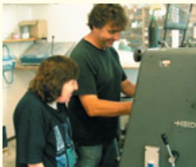
De drukker en zijn medewerker

Werkzaamheden die je kunt doen zijn: vouwen, knippen, kleuren, verven, tekenen, marmeren en veel plakken.